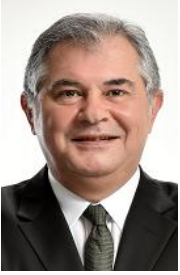
Moderatör: Fuat Akdağ, Doğuş Yayın Grubu, Spor Grup Başkanı