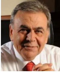
Aziz Kocaoğlu İzmir Büyükşehir Belediye Başkanı

10.00 – 11.15 1. OTURUM ENERJİ ÜSSÜ EGE BÖLGESİ