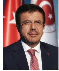
Nihat Zeybekci Türkiye Cumhuriyeti Ekonomi Bakanı