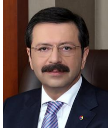
Rifat Hisarcıklıoğlu Türkiye Odalar ve Borsalar Birliği Başkanı