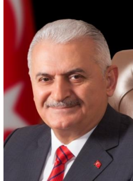
Binali Yıldırım Türkiye Cumhuriyeti Başbakanı