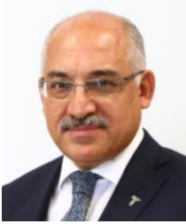
Mehmet Büyükekşi Türkiye İhracatçılar Meclisi Başkanı