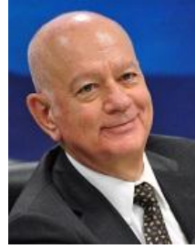
Dimitri Papadimitriou Yunanistan Ekonomi ve Kalkınma Bakanı