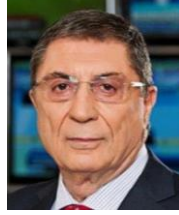
Erman Yerdelen Doğuş Yayın Grubu Yönetim Kurulu Başkanı